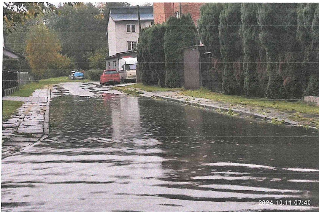
skrzyżowanie ul. Świerkowej i Spokojnej