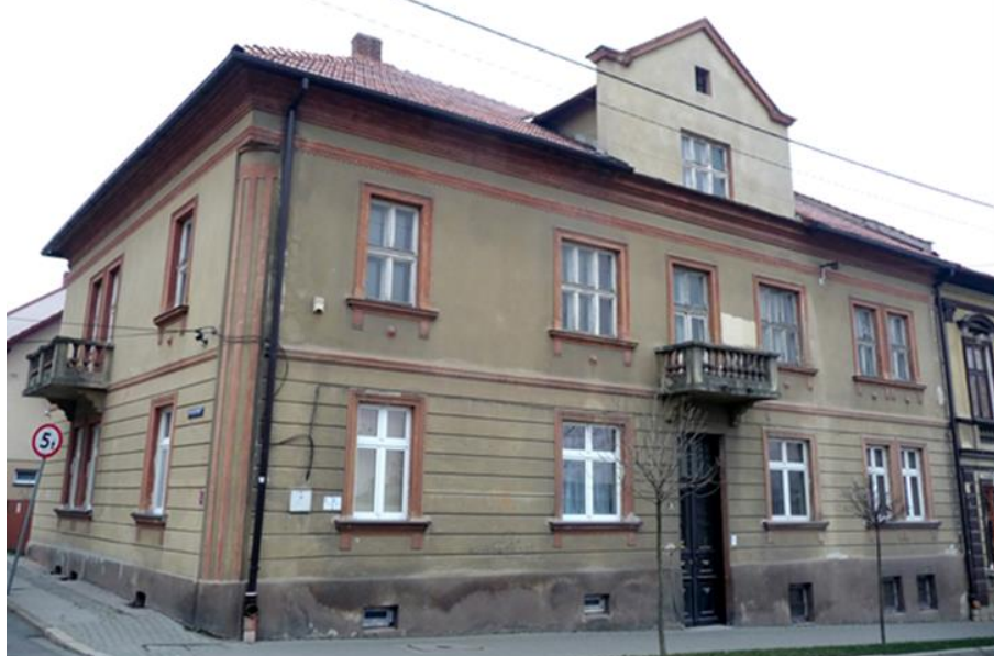
Przed remontem