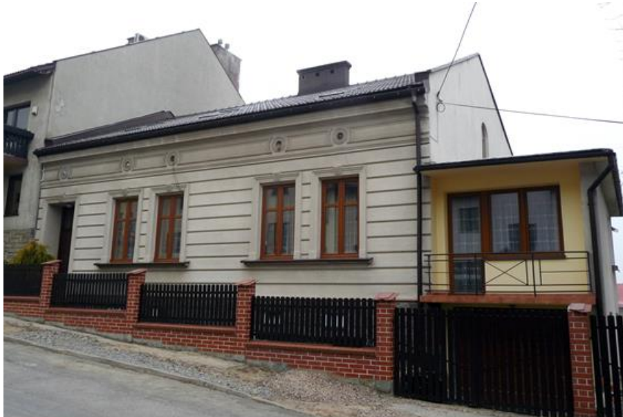
Przed remontem