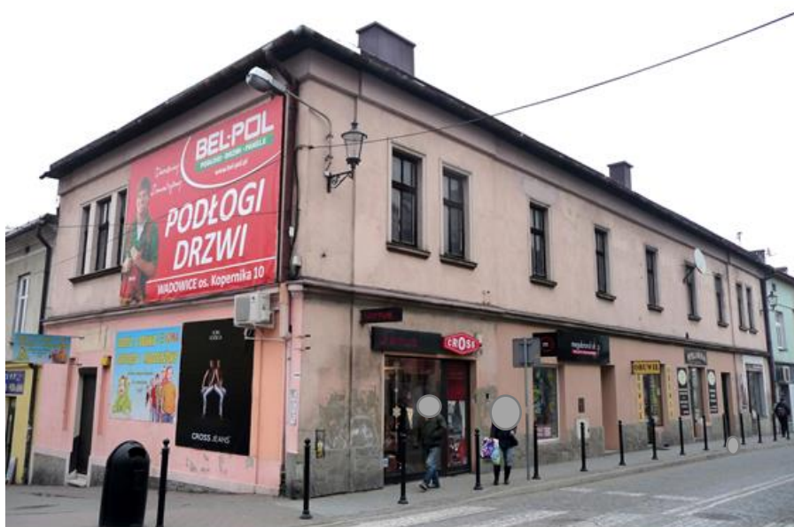
Przed remontem