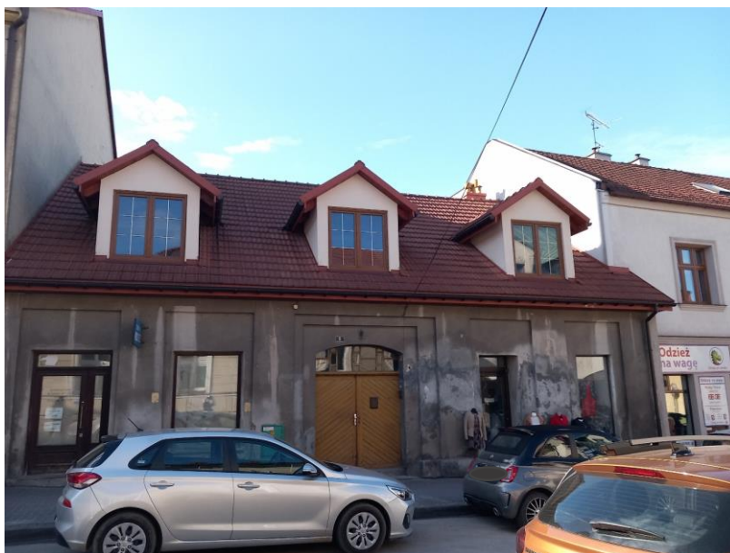
Po remoncie – luty 2024 r.