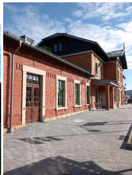
Po remoncie – luty 2024 r.