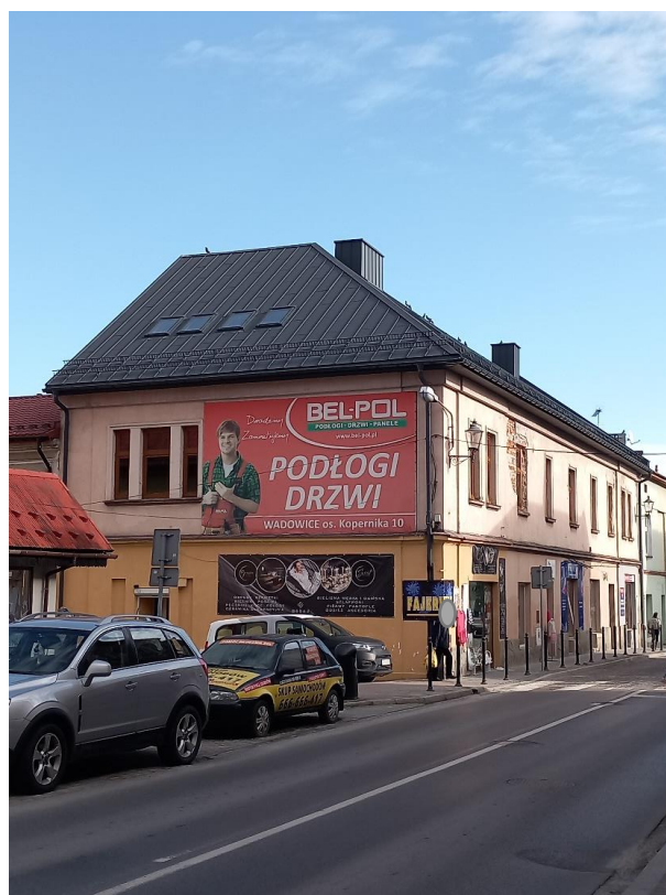
Po remoncie – luty 2024 r.