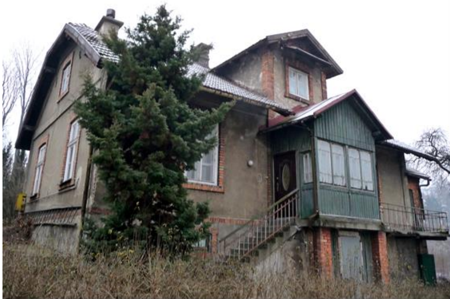
Przed remontem