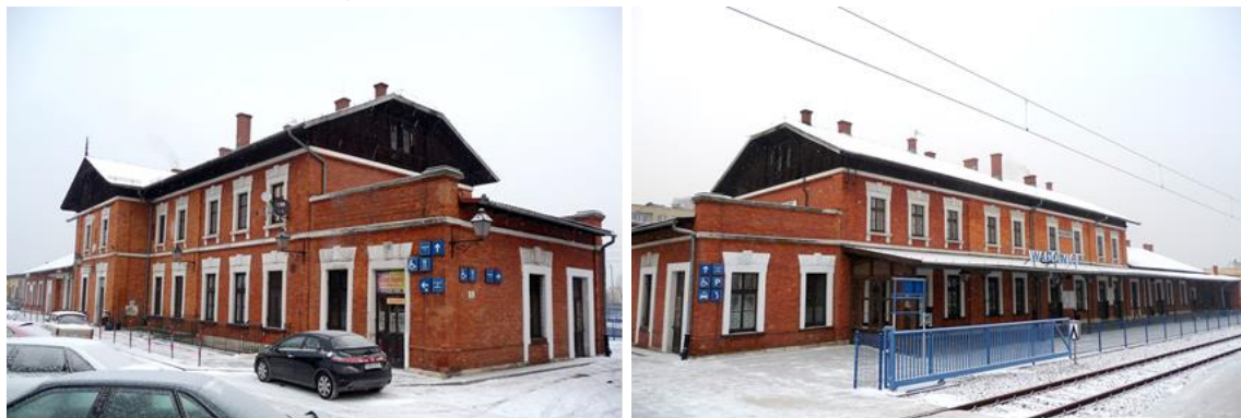
Przed remontem