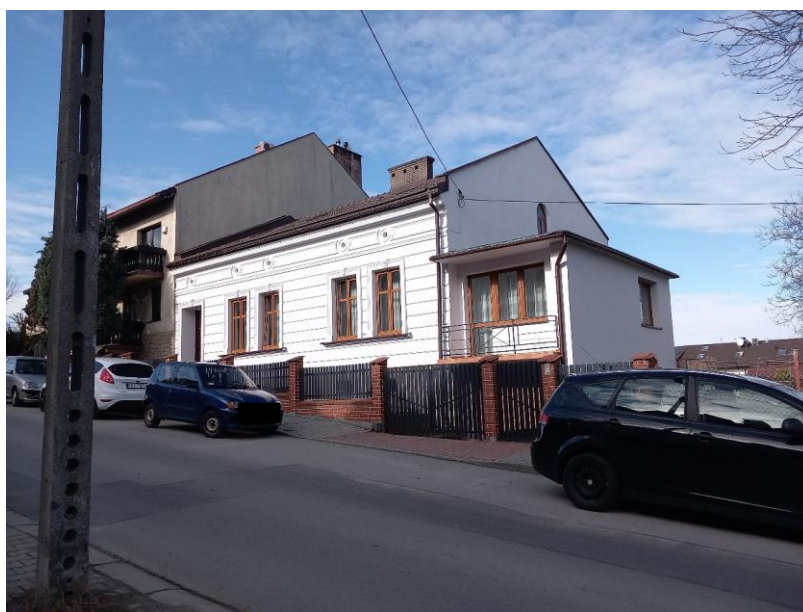
Po remoncie – luty 2024 r.