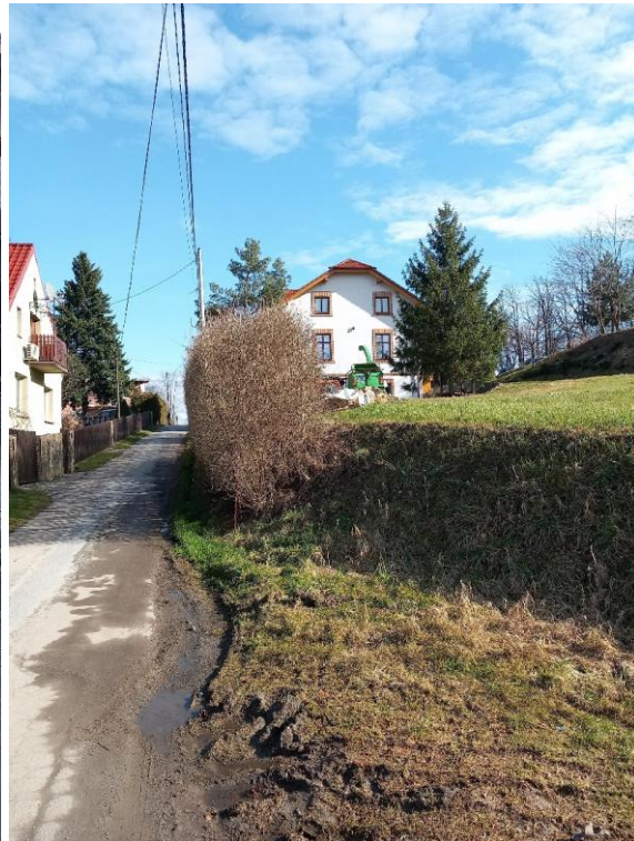
Po remoncie – luty 2024 r.