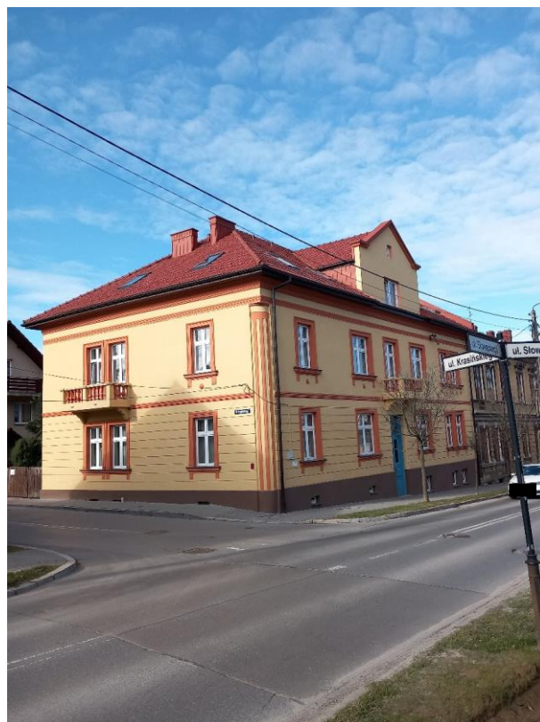
Po remoncie – luty 2024 r.