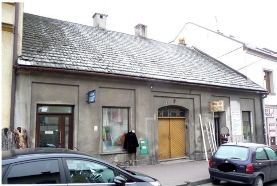
Przed remontem